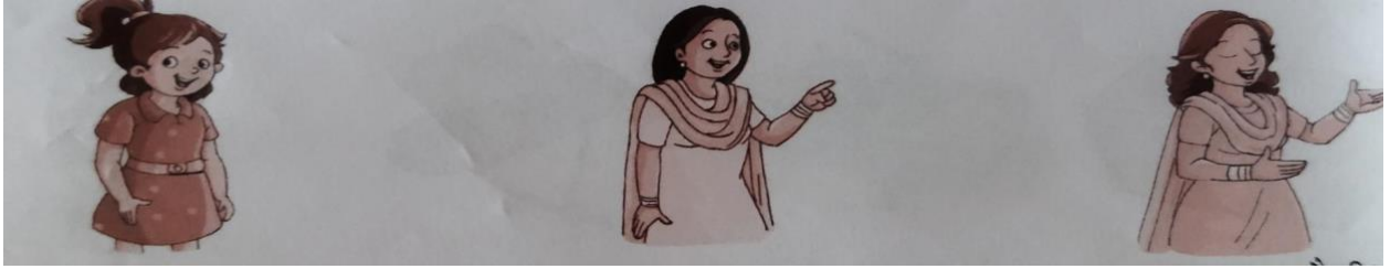
अनुजा (छोटी बहन)